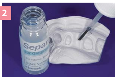
2 Нанесение сепаратора Gingifast Separator на матрицу из Zetalabor