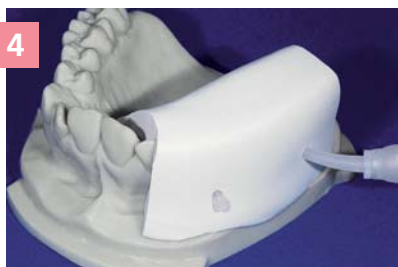
4 Установка матрицы из Zetalabor на модель и введение Gingifast Elastic