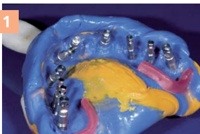
1 Подготовка оттиска

Сбалансированная твердость облегчает фрезеровку краев во время финишной обработки десневой маски на модели.