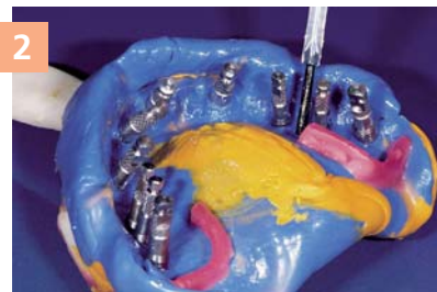
2 Нанесение сепаратора Gingifast Separator на оттиск