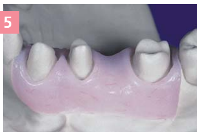
5 Фрагмент десневой маски после окончательной обработки