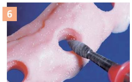
6 Простота фрезеровки