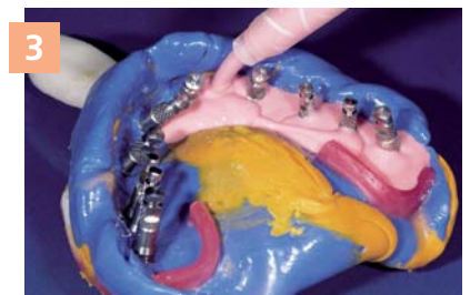
3 Фрагмент носика канюли, погруженного в материал во время выдавливания