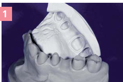
1 Мастер-модель с матричным оттиском из Zetalabor

GINGIFAST ELASTIC позволяет получить эстетический результат благодаря своей полупрозрачности и наличию васкулярных прожилок, придающих ему натуральный вид.