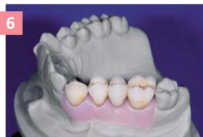
6 Готовая работа на мастер-модели