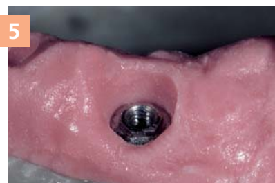
5 Фрагмент воспроизведенной десны