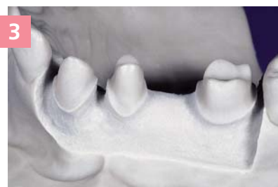
3 Участок мастер-модели, обработанный для нанесения Gingifast Elastic